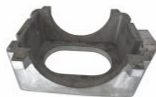
3998 - Resistência fundida em alumínio tem longa durabilidade