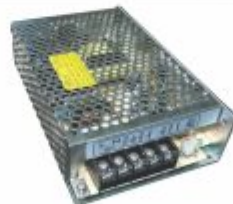
6425 - Fonte alimentação chaveada para instrumentação 24Vdc