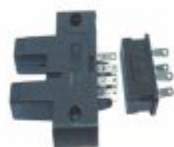
6107 - Sensor fotoelétrico tipo forquilha formato de U