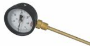
401 - Termômetro 0 a 150, 200,300°C Ø3x150mm rosca 1/2 bsp