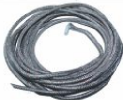
1385 - Resistência flexível tipo traço 30W/mt para aquecer tubulação