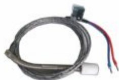
1080 - Termopar para cilindro rotativo em teflon