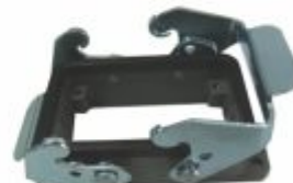
5568 - Carcaça base baixa 2 travas para tomada multipolar