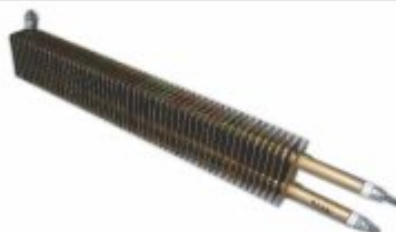
4446 - Resistência aletada para aquecimento de ar ou estufas