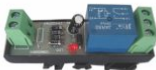
3084 - Relé acoplador 12, 24, 110 ou 220V uso em CLP