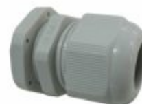
6324 - Prensa cabo plástico ou metálico