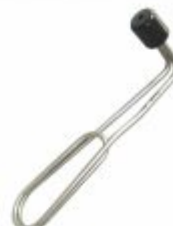
4689 - Resistência de borda para banhos químicos