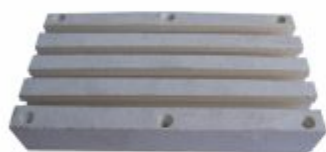
2713 - Cerâmica canal aberto para fornos e estufas