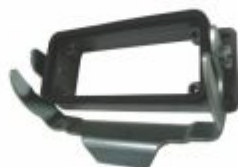
5565 - Carcaça base baixa 1 trava para tomada multipolar