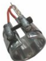
2867 - Resistência coleira de mica para extrusora