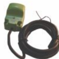
3596 - Sensor indutivo redondo 220V