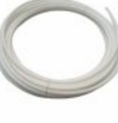
2375 - Tubo teflon para isolamento anti aderente