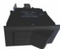
4171 - Chave liga/desliga de tecla 4 pinos