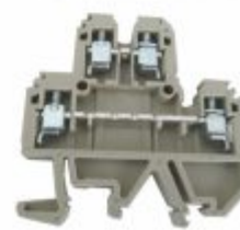
5735 - Borne sak duplo 4mm