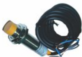
6244 - Sensor cilíndrico Ø 8-12-18-30-50mm