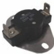
2114 - Termostato flange NF 56 °C 25A para aquecedor solar