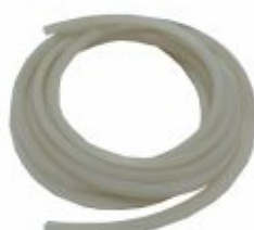
396 - Perfil de silicone 270°C para seladora