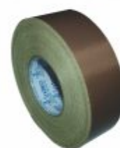
845 - Fita teflon com adesivo espessura 0,13mm x 15, 25, 30,75,150, 200mm