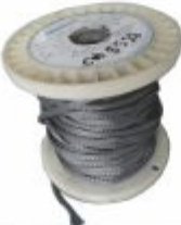
5522 - Conduite espaguete malha metálica