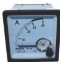
6658 - Amperímetro analógico direto ou com TC