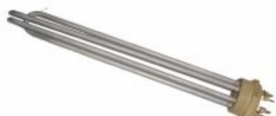
6461 - Resistência de inox com rosca de 1-1/4", 1-1/2", 2", 2-1/2" para tanques fechados