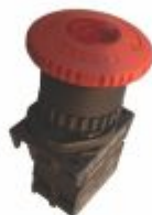
5752 - Botão de emergência com trava e led 12/24V ou 110/220V