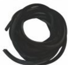
1619 - Perfil de borracha 13x13mm esponjoso para seladoras