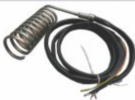
6487 - Resistência microtubular com termopar diâmetro 15 a 60mm para longa duração nos bicos de injetoras