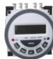
3701 - Programador horário Tm 619 Novus