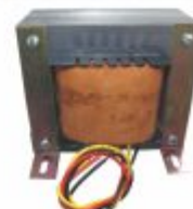
5623 - Transformador para corte quente