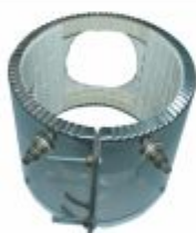
4990 - Resistência coleira de cerâmica alta potencia