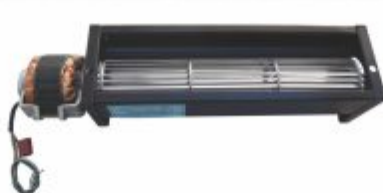
4994 - Ventilador linear para circulação de ar quente