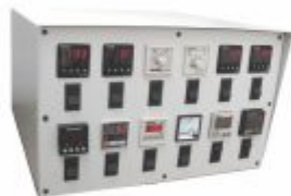
1101 - Painel de comando de 12 zonas para controle de tempo, temperatura, processos em geral