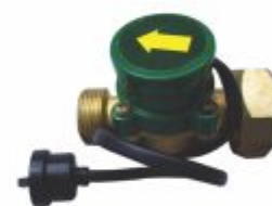
2234 - Fluxostato detecta fluidez do líquido