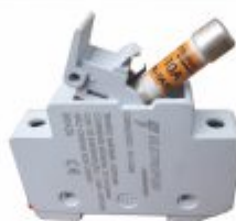
5533 - Base de fusível 10x38mm 32A até 500V