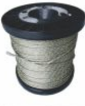
784 - Cabo de compensação tipo K 2x24 Awg