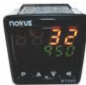
5136 - Controlador de tempo, temperatura ou contadores duplo display Novus