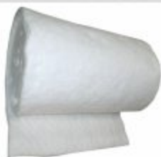
5492 - Isolante de temperatura tipo Lã Rocha, Fibra de Vidro e Fibra Cerâmica