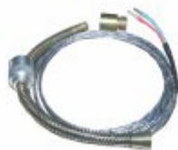
1609 - Termopar flexível com baioneta pequena ou grande (J, K, PT-100)