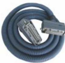
5927 - Conduite poliamida resistente para máquinas