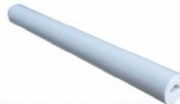
3147 - Tubo alumina Ø 8-10-12,7mm para fabricação de ignitor e sensor de chama