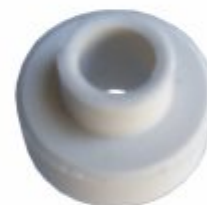
2950 - Cerâmica isoladora macho com furo diâmetro 5/32", 3/16", 1/4", 1/2", etc.