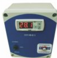
1860 - Painel CDT para aquecimento solar e piscina