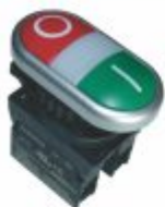
5753 - Botão liga/desl com led 12/24V ou 110/220V