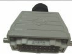
5925 - Carcaça plug 16 pinos para tomada multipolar