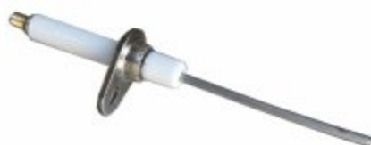
3933 - Eletrodo de ignição com suporte