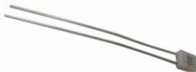
5196 - Fusível térmico para motor elétrico 60 a 150°C