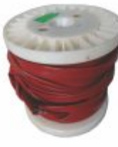
120 - Espaguete silicone 1,5 a 32mm 2 200°C