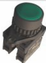
6431 - Botão de impulso verde