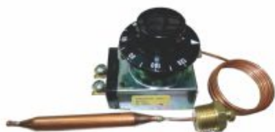
44 - Termostato capilar 20 a 120°C com rosca 3/8" 30A Robertshaw