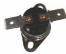
819 - Termostato flange NA ou NF 40 a 250°C