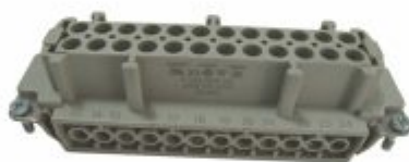
5562 - Miolo fêmea para tomada multipolar 6-10-16-24 pinos