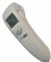
3381 - Termômetro infra-vermelho escala de -60 a 500°C mira laser