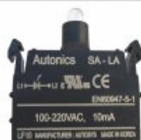
5757 - Bloco de iluminação com led 12/24V ou 110/220V