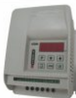
4651 - Inversor de frequência entrada bifásica/trifásica saída trifásica