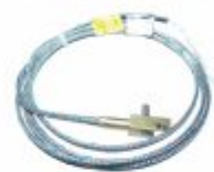
4952 - Termopar para manifold em latão ou inox