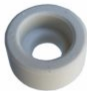
2957 - Cerâmica isoladora fêmea com furo diâmetro 5/32", 3/16", 1/4", 1/2", etc.