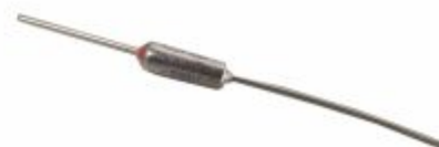
4247 - Fusível térmico fusistor 40 a 240°C