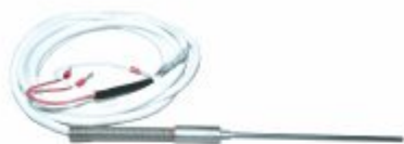
5091 - PT-100 Ø1,5- 3- 6mm x comp. de 30mm a 100mm cabo de silicone