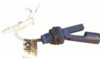
2735 - Chave bóia para fluidos