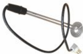
6559 - Resistência ebulidor portátil para aquecimento rápido de água