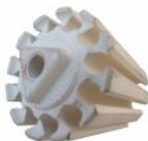
3216 - Cerâmica tambor 12 furos para cilindro e sopradores térmicos