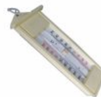
2989 - Termômetro para ambiente