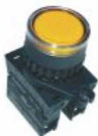
5747 - Botão de impulso amarelo com led 12/24V ou 110/220V