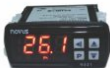
5137 - Controlador de temperatura ou tempo caixa 33x75mm