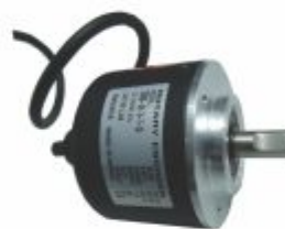
3352 - Encoder rotativo gera 1, 24, 60, 100, 1024, etc. pulsos por volta