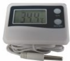
6275 - Termômetro digital de -50° a 70°C