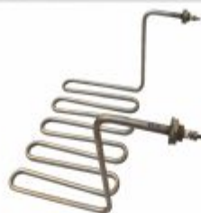
1227 - Resistência para fritadeira 3kW 127V e 5kW 220V