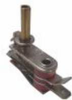
626 - Termostato de lâmina ajustável 0 a 300°C