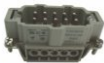
4085 - Miolo macho para tomada multipolar 6-10-16-24 pinos