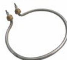
3392 - Resistência circular para equipamentos de laboratório e centrífugas