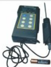
3826 - Termômetro digital portátil com sensor