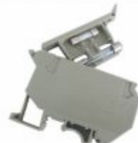
3086 - Borne sak fusível de vidro 4mm 2