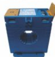
3115 - Transformador de corrente (TC)