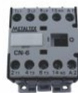
3947 - Contactor tripolar com contatos auxiliares de 1 a 270 CV/HP