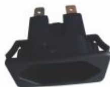
6490 - Tomada embutir em painel 20A