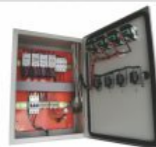
6104 - Painel de comandos elétricos e eletrônicos