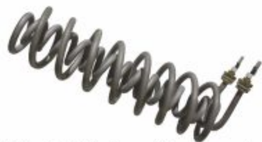
1549 - Resistência espiral para grande potência em um pequeno espaço