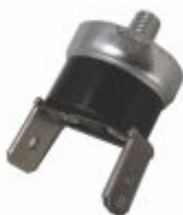
5719 - Termostato parafuso NF ou NA 40 a 150 °C