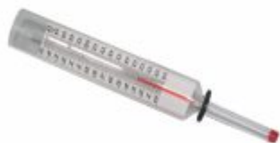
5184 - Termômetro de vidro 0 a 150°C haste 100mm