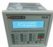
6054 - CLP com IHM com ent. analógica e controle de temperatura, 12 entradas e 12 saídas