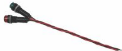
2461 - Lâmpada sinaleira vermelha, verde ou branca