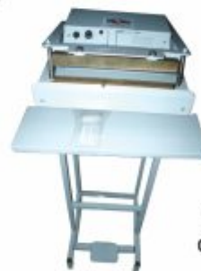
6187 - Seladora e datadora industrial