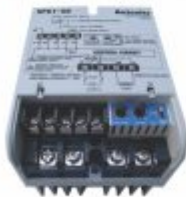
3346 - Chave de potência tiristorizada controla em ângulo de fase ou trem de pulso