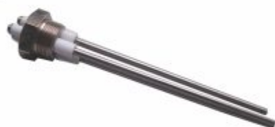
3120 - Eletrodo de nível com 3 hastes