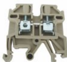
3684 - Borne sak 0,5 a 35mm 2