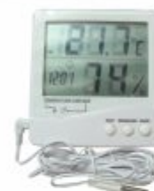
5660 - Termo-higrômetro mede temperatura e umidade