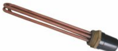
731 - Resistência de cobre com rosca de 1-1/4", 1-1/2", 2", 2-1/2" para tanques fechados