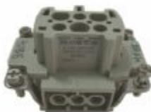
4088 - Miolo fêmea para tomada multipolar 6-10-16-24 pinos