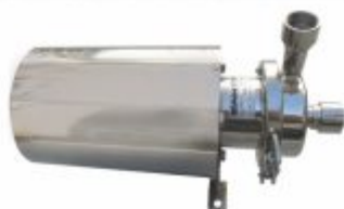
6456 - Bomba Inox para água quente