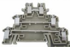
6307 - Borne sak triplo 2,5mm