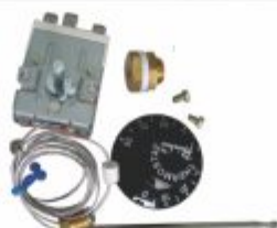
372 - Termostato capilar 50 a 300°C com rosca 3/8" 30A