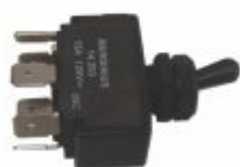
1090 - Chave liga/desliga de alavanca 6 pinos