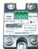
4532 - Relé de estado sólido sinal 0 a 10V ou potenciômetro