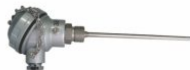
333 - Termopar com cabeçote, haste de 50mm a 2mt com rosca 1/2 bsp, npt (J, K, PT-100)