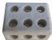
5675 - Conector sindal porcelana 10mm