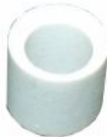
4223 - Cerâmica isoladora miçanga furo diâmetro 2 a 16mm