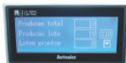
6258 - CLP com IHM 4.4" touch screen 16 entradas/16 saídas