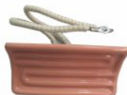
3665 - Resistência cerâmica infravermelho, transfere calor por irradiação