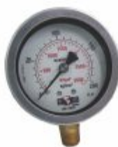
2247 - Manômetro Ø60mm escala 0 a 2, 5, 10, 25, 50, 100, 200, 300 kgf, Bar, kPa, lbf com rosca 1/4npt