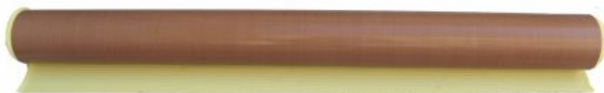
3303 - Fita teflon com ou sem adesivo espessura 0,8- 0,13-0,25x 1000mm