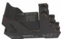
3682 - Relé acoplador duplo 12 ou 24V