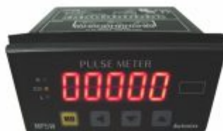
6695 - Metrador para revisadeiras