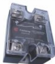
4721 - Relé de estado sólido de 10 a 100A