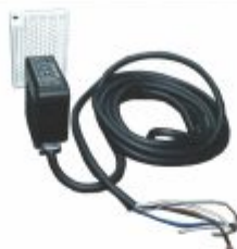
3349 - Sensor reflexível difuso com barreira