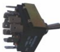
3890 - Chave de reversão tetra polar