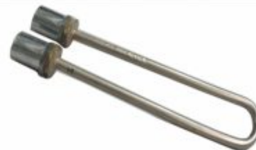
27 - Resistência para marmiteiro 1000 a 3500W