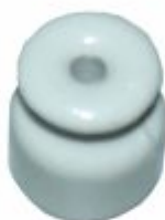
712 - Cerâmica roldana isoladora