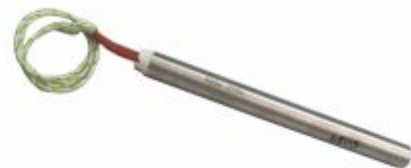
6089 - Resistência cartucho utilizada em moldes