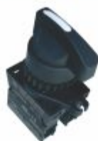
5749 - Chave comutadora 2 ou 3 posições