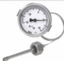
4556 - Termômetro com capilar a distância