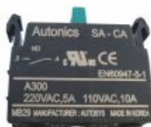
5754 - Bloco de contato 1 NA ou NF