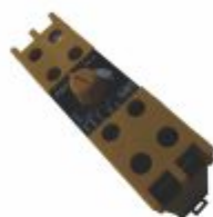
4003 - Relé de nível para líquidos condutivos