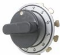
778 - Chave seletora 10 posições 15A e 30A