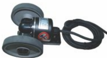
4821 - Encoder rotativo para medição direta mm, cm ou metros