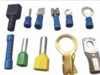
5656 - Terminais diversos